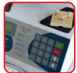
Display alfanumérico Alphanumeric display