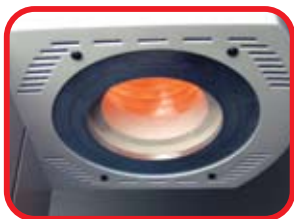
Mufla protegida con cristal de cuarzo Quartz muffle